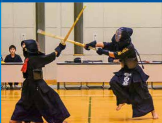
剣道部(男子・女子)