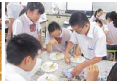
エネルギー環境講座