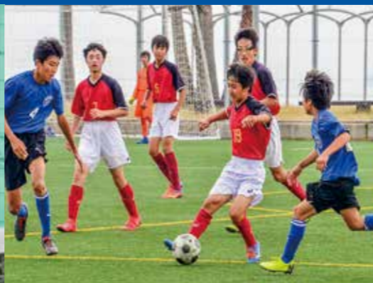
サッカー部(男子・女子)