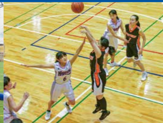
バスケットボール部(女子)