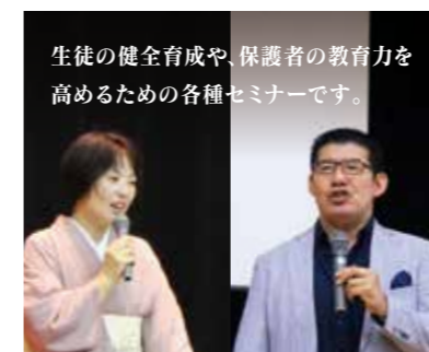
生徒の健全育成や、保護者の教育力を高めるための各種セミナーです。