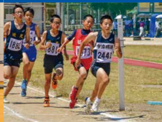
陸上競技部(男子・女子)