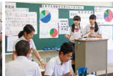
ディベート(教室討論会)