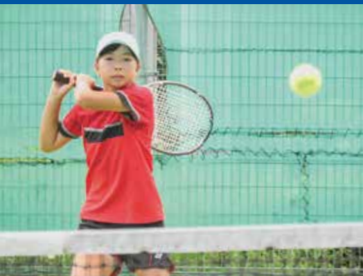
テニス部(男子・女子)