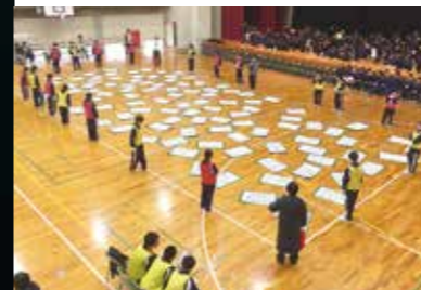
大判百人一首大会